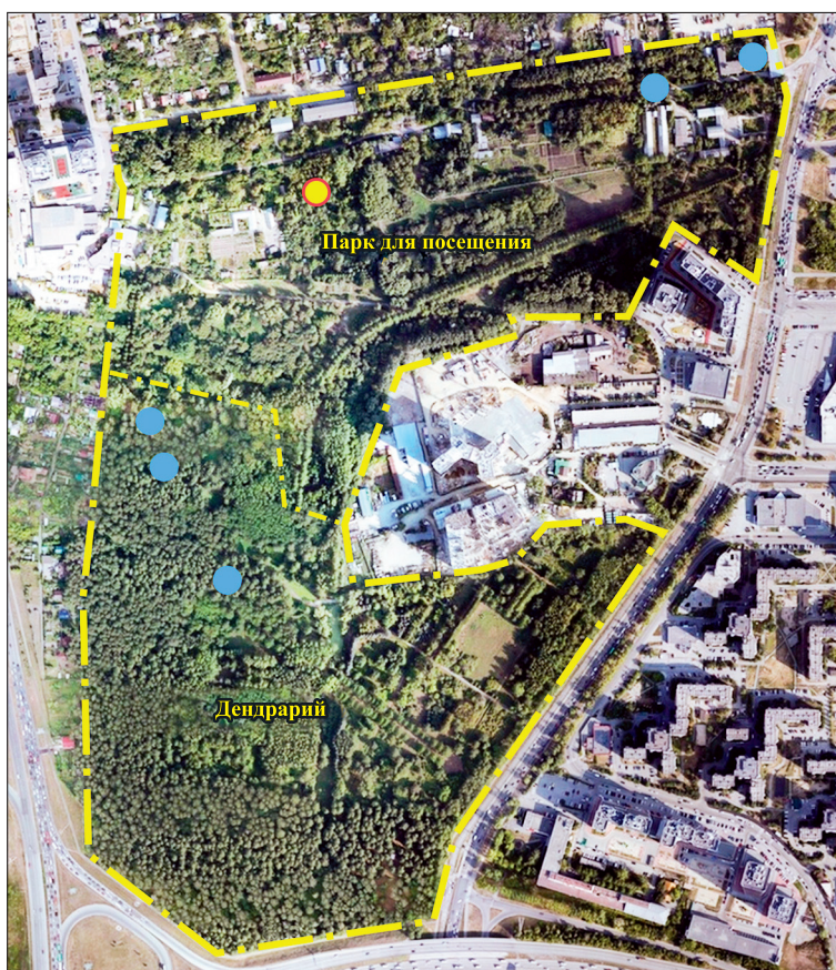
Рис. 1. Схема территории Ботанического сада УрО РАН в г. Екатеринбурге с указанием положения куртин пихт с пораженными уссурийским полиграфом деревьями на начало августа 2023 г. (синие кружки). Детально изученная куртина деревьев обозначена желтым кружком в красной окантовке.

Осмотр образцов с помощью стереомикроскопа МБС-9 (Россия) и фиксирование формирующихся колоний и грибных структур проводили еженедельно в течение 35 дней. Для изолирования в чистую культуру использовали мицелий вблизи крупных перитециев и капли слизи с вершины шейки перитециев. Питательной средой для изолирования и хранения культур было агаризованное неохмеленное пивное сусло (2° по Баллингу). Первичную идентификацию грибов выполнили на основании культуральных свойств и микроморфологических характеристик.