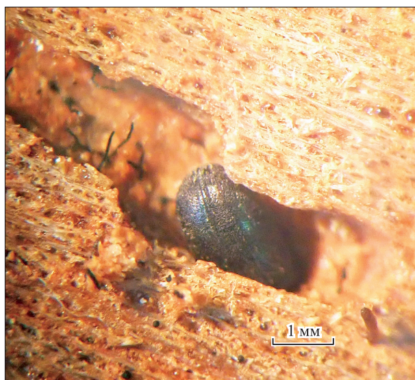
Рис. 3. Шейки зрелых перитециев гросмании Аошимы и погибший жук в маточном ходе уссурийского полиграфа на пихте сибирской.

На поверхности тканей, прилегающих к гнездам уссурийского полиграфа, уже в первую неделю лабораторных наблюдений отмечали формирование новых плодовых тел в виде шарообразных оснований. Это указывает на то, что